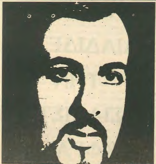
ΑΦΙΕΡΩΜΑ ΣΤΟ ΣΥΝΤΡΟΦΟ ΔΑΣΚΑΛΟ στις μεσαίες σελίδες

Στην πραγματικότητα η θριαμβολογία της ηγεσίας της ΕΔΕΚ είναι απόπειρα συγκάλυψης της απογοήτευσής της από τα αποτελέσματα. Μια απελλιπτικά ερασιτεχνική «δημοσκοπήση» που αποπειράθηκε η Εβελίτικη γραφειοκρατία πριν τις εκλογές τους άφησε να πιστευούν ότι η ΕΔΕΚ θα ξεπερνούσε το 10%. Η απογοήτευση της βάσης της ΕΔΕΚ από το